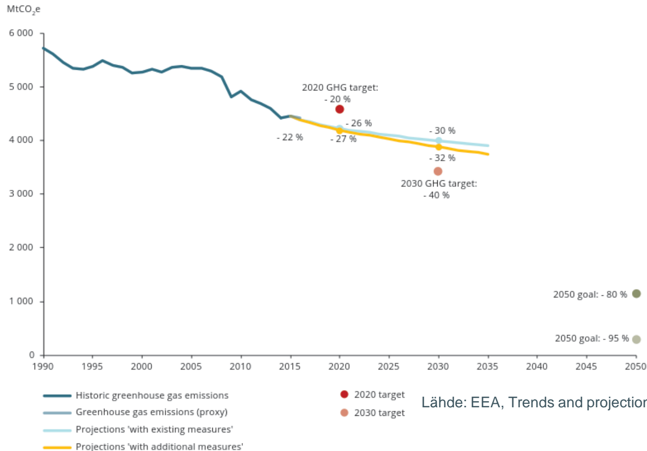
Figure 2.1 Greenhouse gas emission trends, projections and targets in the EU