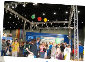
Farmari 2008 Lahti