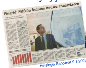
Helsingin Sanomat 9.1.2008