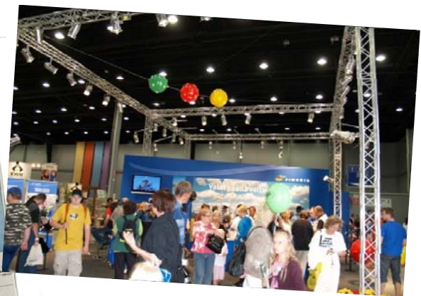
Farmari 2008 Lahti