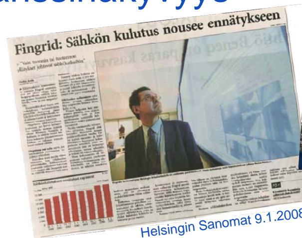
Helsingin Sanomat 9.1.2008