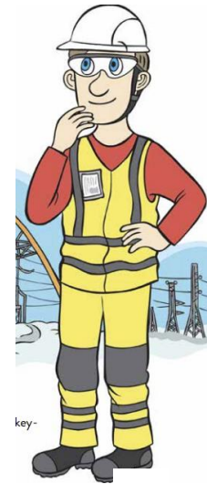
Turvallisuus töissä ja vapaa-ajalla

Mitä toimenpiteitä olette tehneet / tulette tekemään painopisteisiin liittyen?