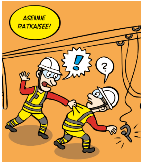
Latausjännitteet ja sähkön vaarat