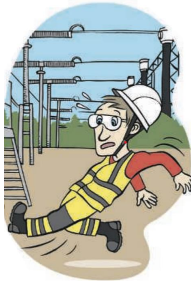
Liukastumiset ja kompastumiset