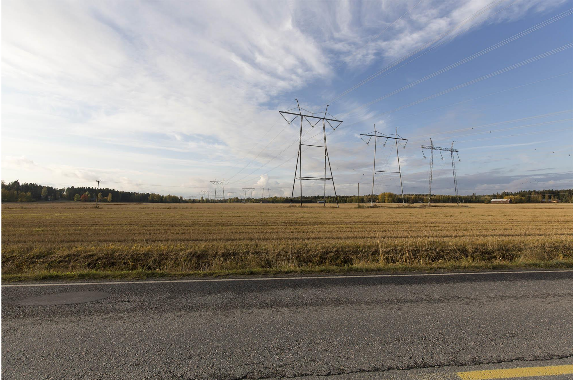
A. Näkymä Korvenkyläntieltä kohti luodetta Huittisten läntisessä vaihtoehdossa A-B1 ja B1-C, joka näkyy etualalla vasemmalla peltotyypisenä portaalipylväänä (16 mm).