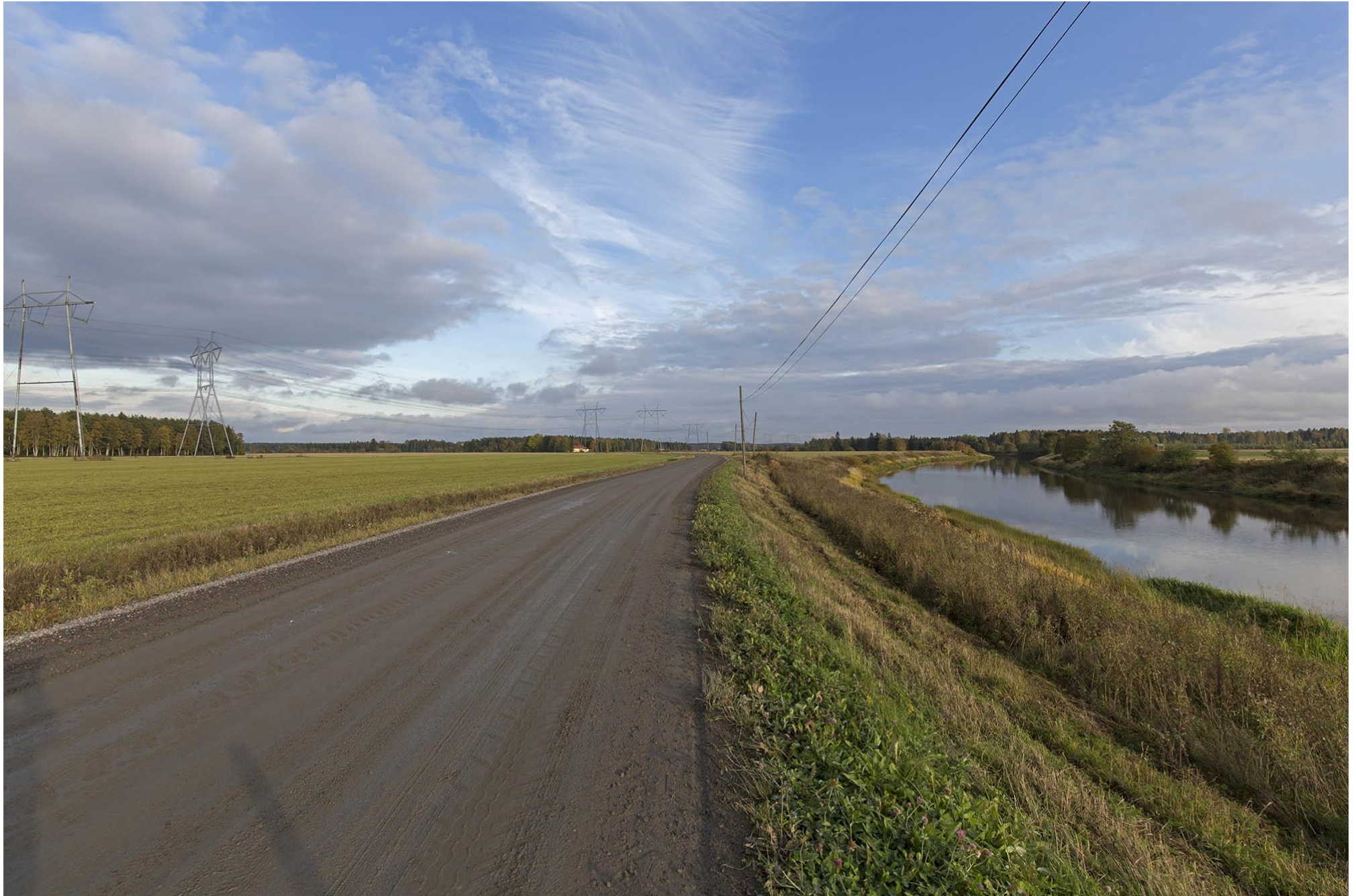
B. Näkymä Loimijokea pitkin voimajohdon ylityskohtaan, C-D on taaempi voimajohto. Huittinen.