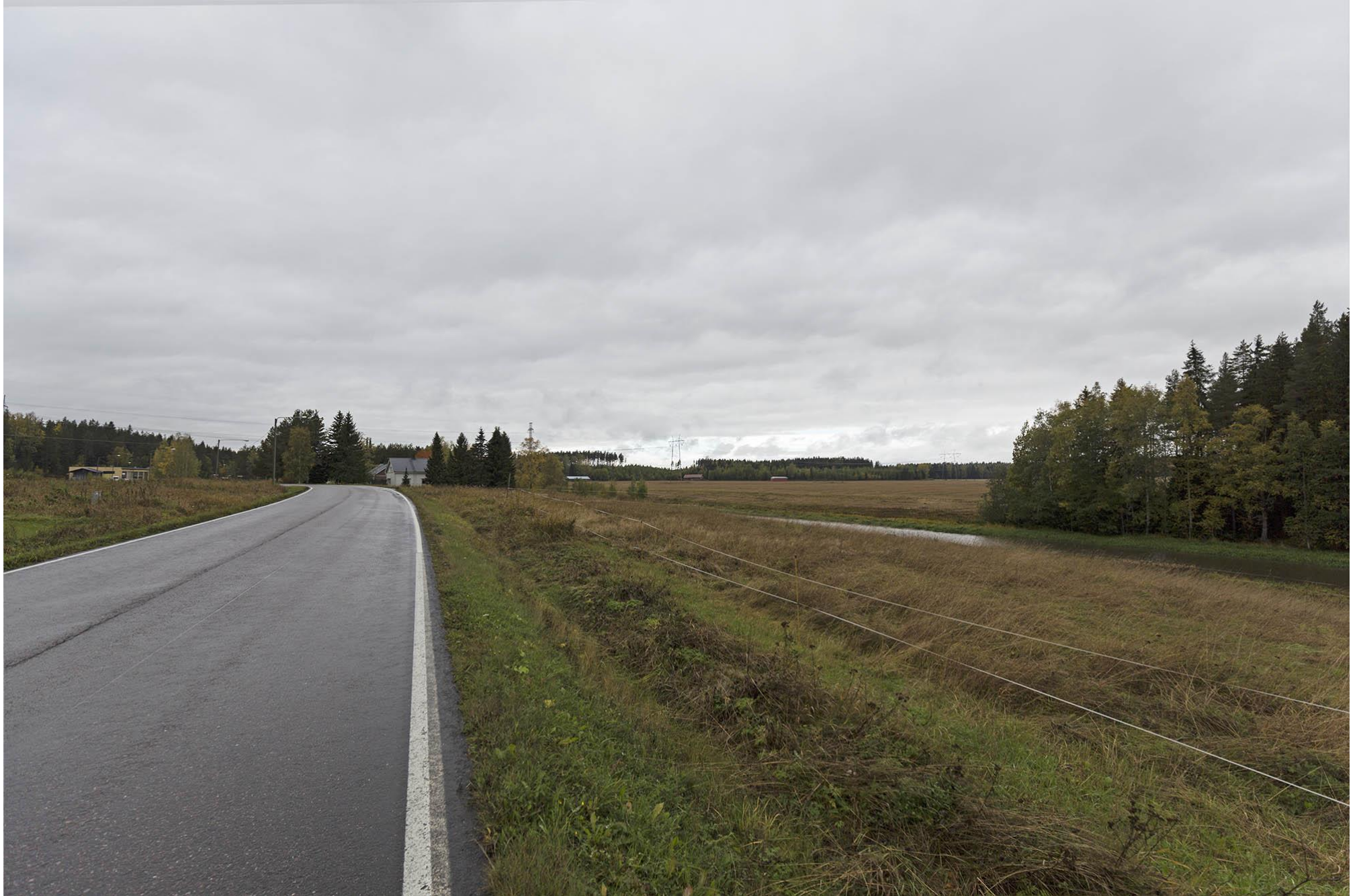
F. Näkymä Leimukallion kohdalta länteen. Jokioinen.