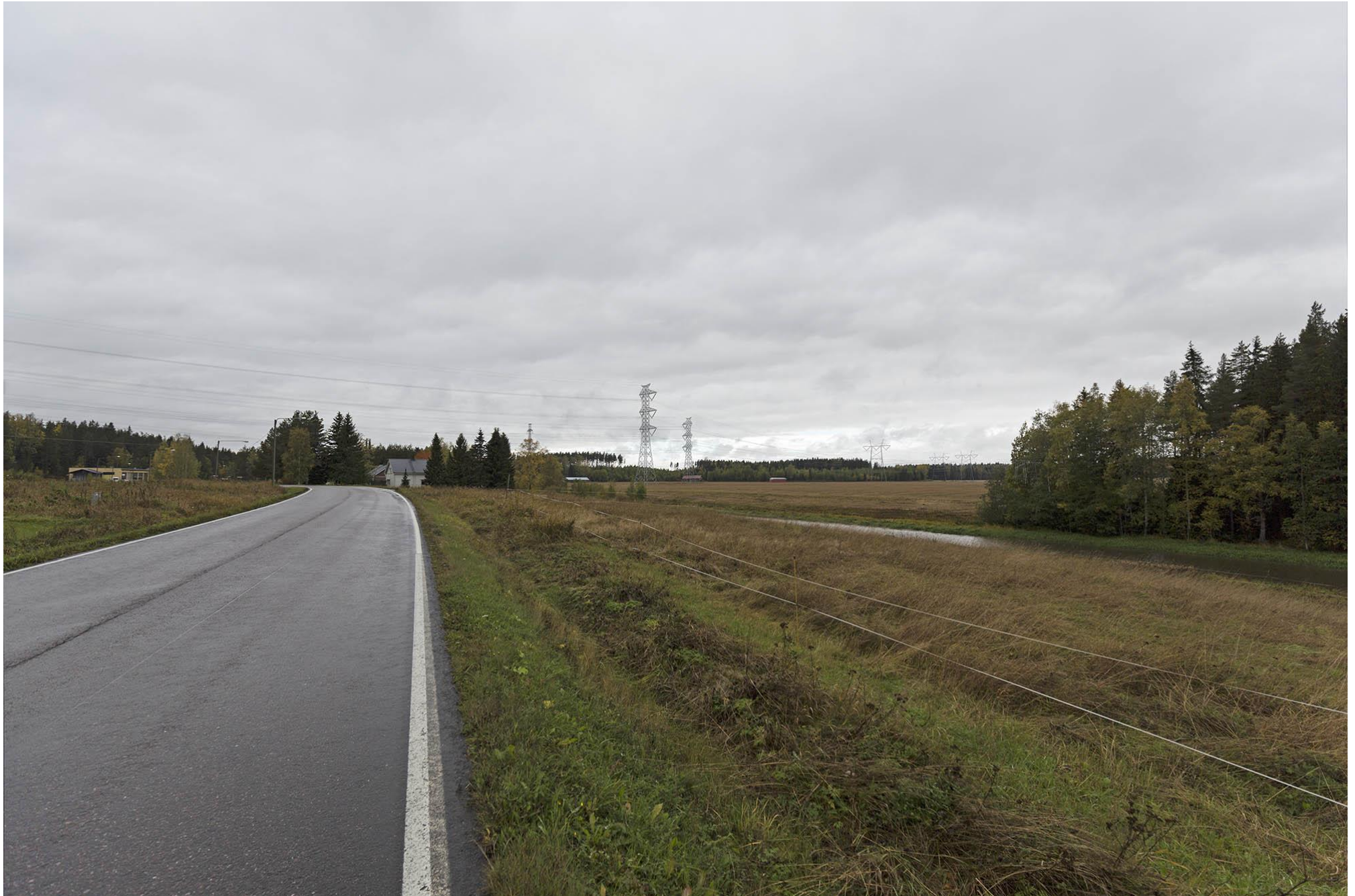
F. Näkymä Leimukallion kohdalta länteen. Kuvassa näkyvät voimajohto-osuudet S-Ta ja S-Tb. Jokioinen.