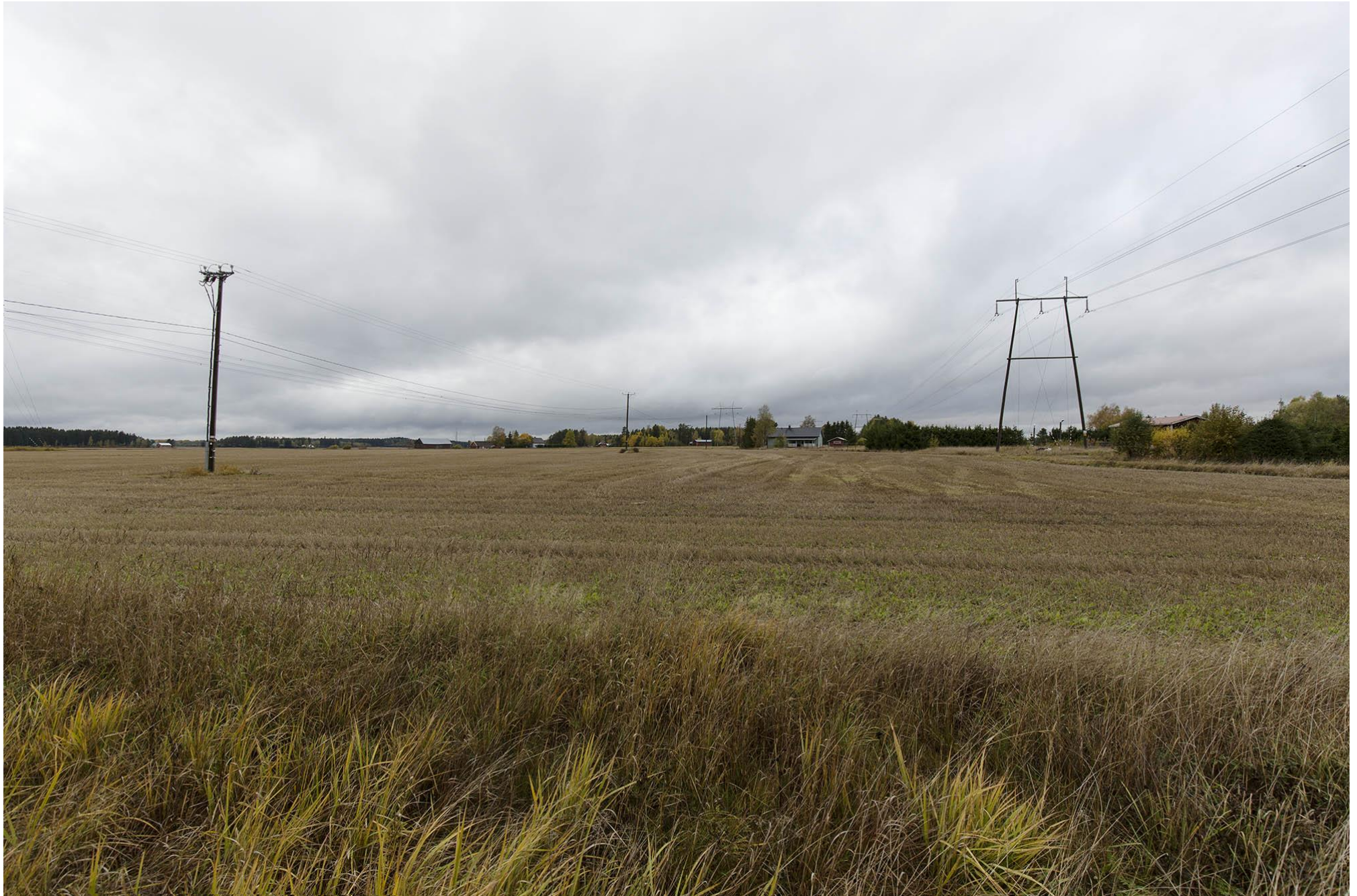
E. Näkymä nykytilanteeseen Minkiöstä Kiipuntieltä pohjoiseen päin katsottaessa. Jokioinen.