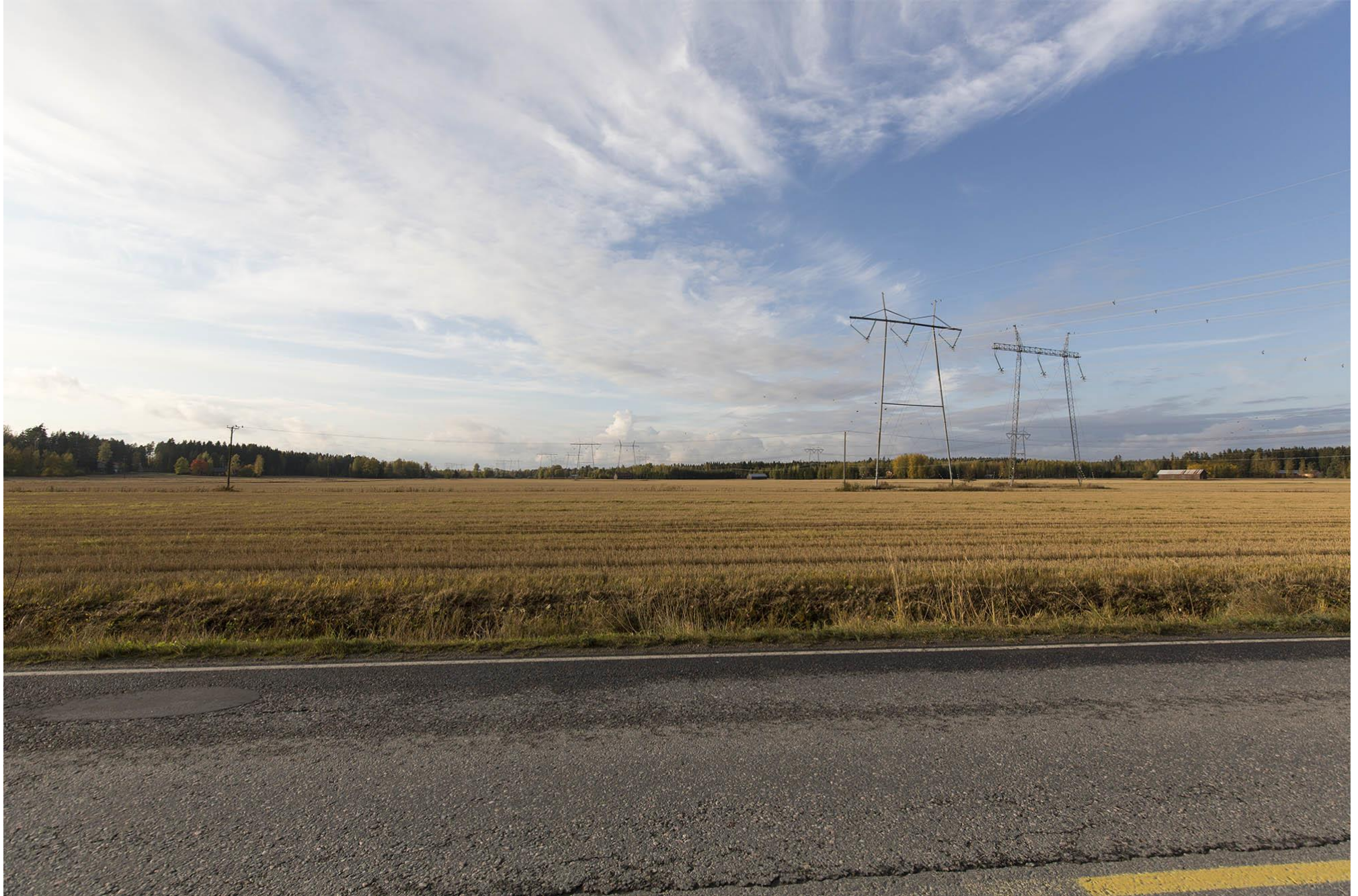
A. Näkymä Korvenkyläntieltä kohti luodetta Huittisten itäisessä reittivaihtoehdossa A-B2-C, joka näkyy taustalla metsänreunassa.