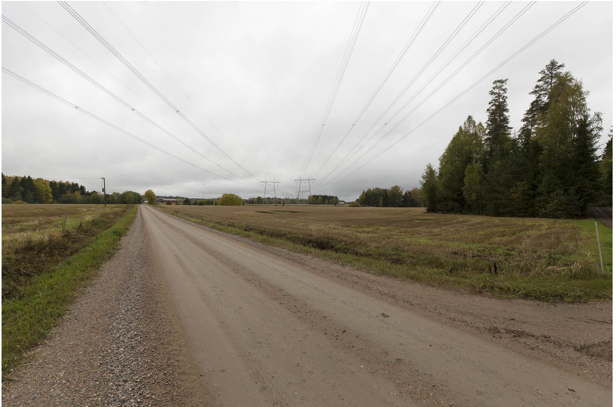
C. Voimajohdon osuus L-M näkyy oikealla Mäki-Uutilan kohdalta pohjoiseen katsottaessa. Loimaa.