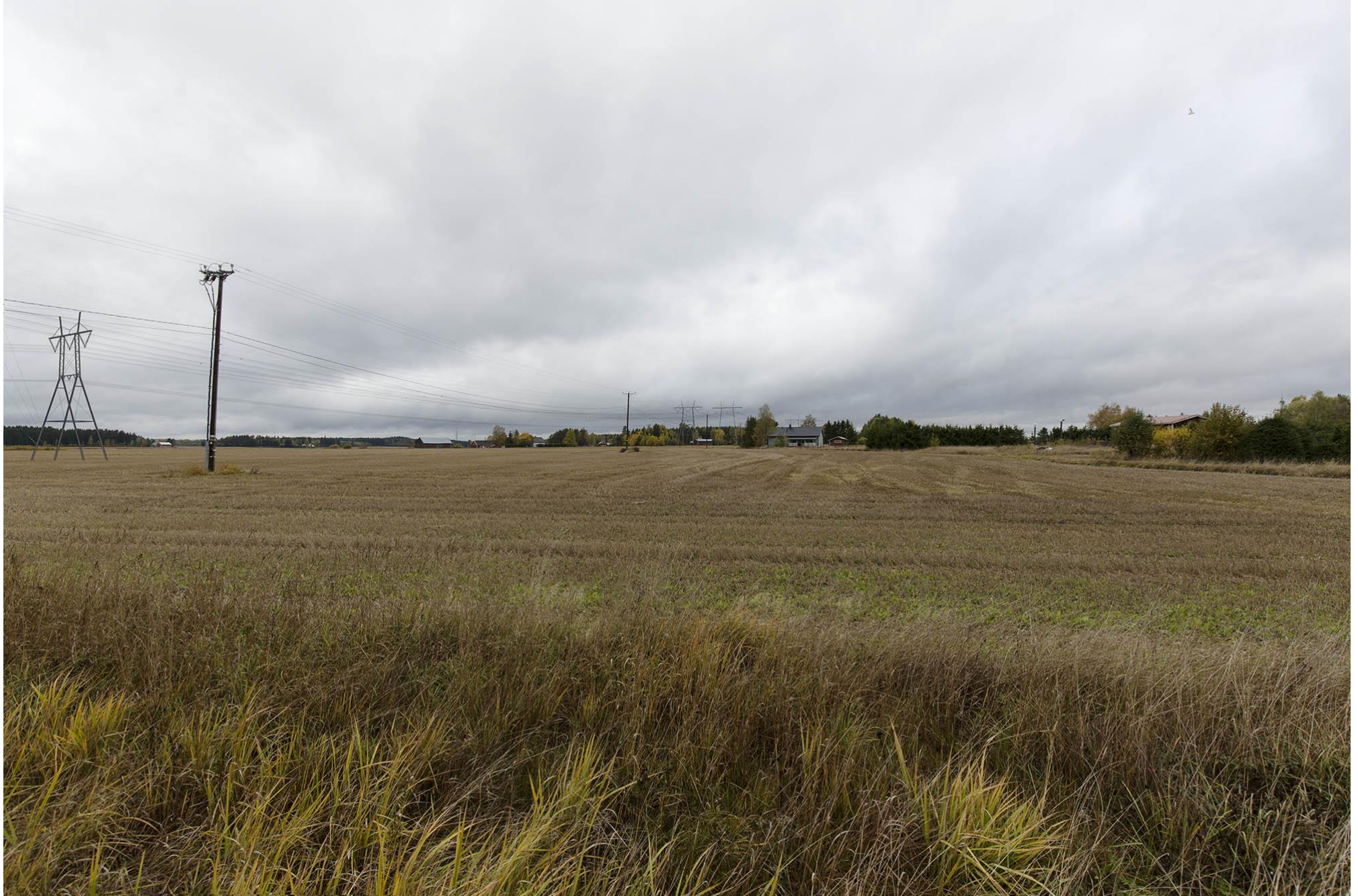
E. Näkymä Minkiöstä Kiipuntieltä pohjoiseen päin katsottaessa. Kuvassa lounainen reittivaihtoehto P-Q1-R on vasemmanpuoleinen voimajohto. Jokioinen.