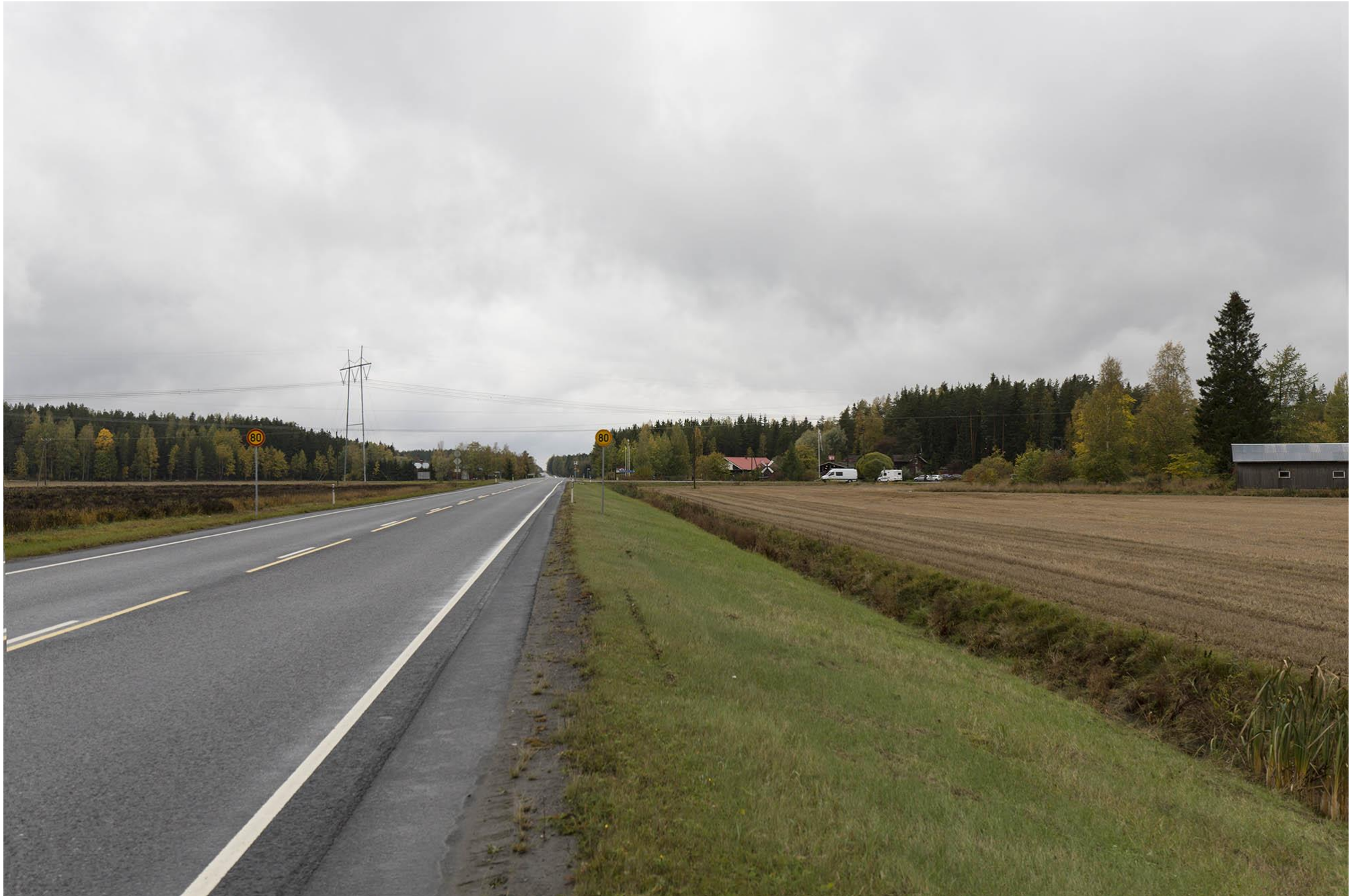
D. Kuva nykytilanteesta Turuntieltä, Valtatie 9, Niinimäen kohdalta. Loimaa.