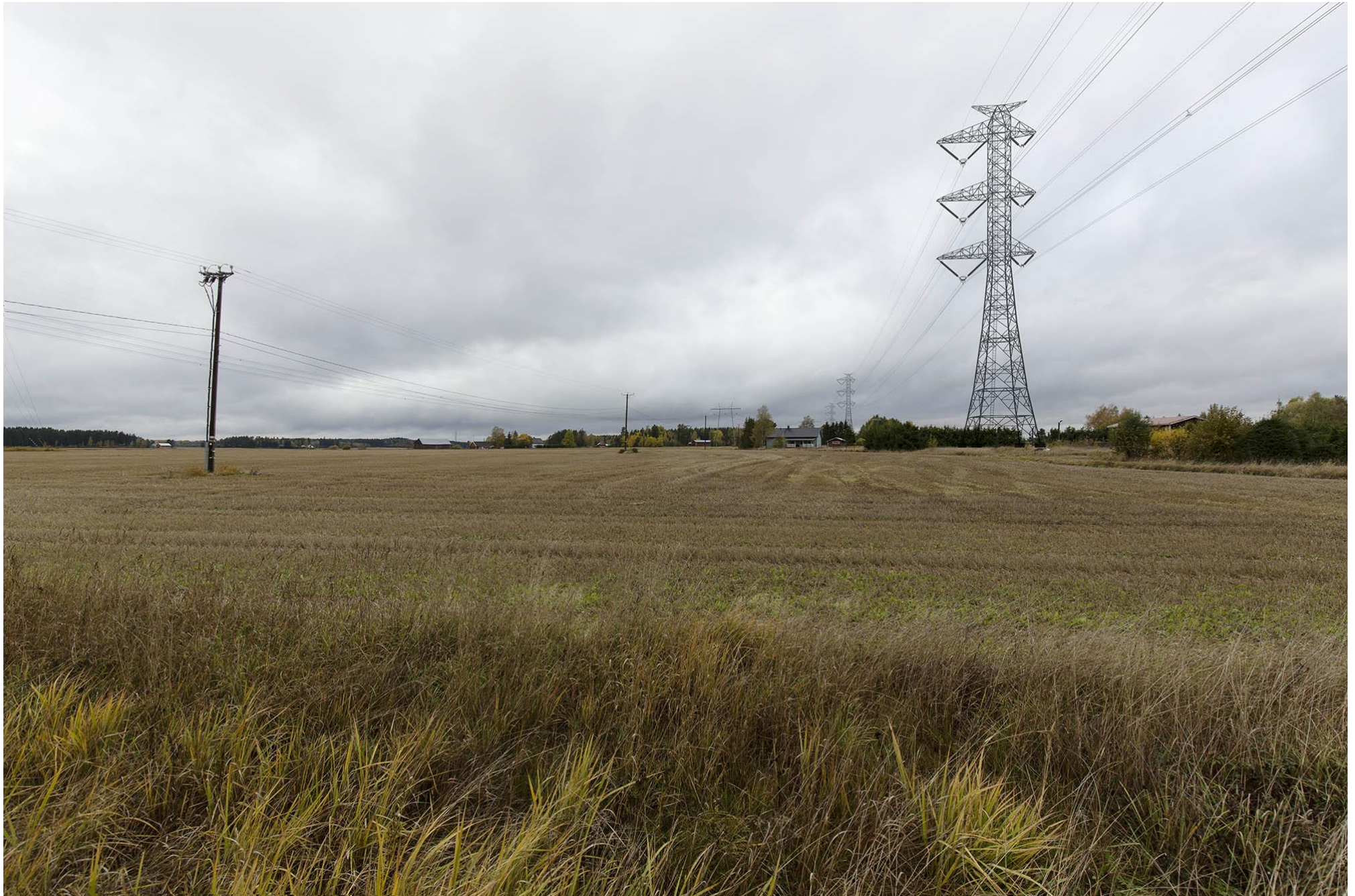
E. Näkymä Minkiöstä Kiipuntieltä pohjoiseen. Kuvassa läntinen alkuperäinen reittivaihtoehto P-Q2-R on oikeanpuoleinen korkea voimajohto (objektiivivi 16mm). Jokioinen.